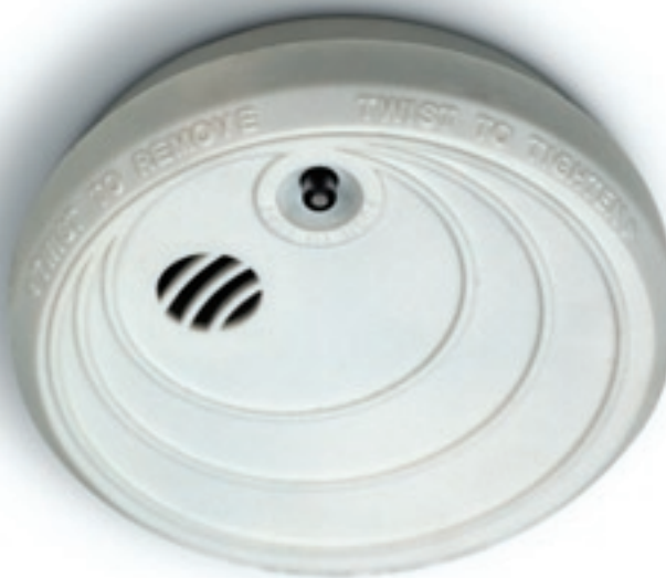
Det ska finnas minst en uppsatt och fungerande brandvarnare i varje lägenhet. Billigare liv- och egendomsförsäkring är svårt att hitta.

En brandvarnare är en billig livförsäkring som varnar snabbt och räddar liv. En tidig upptäckt ger också större möjligheter att begränsa konsekvenserna av branden. I varje bostad ska det finnas minst en fungerande brandvarnare. Finns det någon hörselskadad i bostaden måste behovet av tidig larmning vara tillgodosett även för denne. Det kan exempelvis ske genom att brandvarnaren förses med särskild ljus- eller vibrationsfunktion. En brandvarnare täcker cirka 60 kvadratmeter. Är lägenheten större än så behöver fler brandvarnare installeras. Om bostaden har flera våningsplan bör det finnas brandvarnare på varje våning. Enligt Räddningsverkets allmänna råd om brandvarnare i bostäder, är det lämpligt att ägaren till byggnaden ser till att brandvarnare installeras, men att de boende sedan själva ansvarar för att regelbundet prova att den fungerar och byta batterier vid behov.