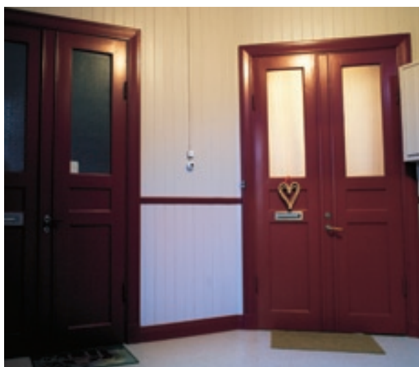
Gamla spegeldörrar är vackra men ger inget bra brandskydd. Skyddet kan dock förbättras genom att man förstärker dörrarna på insidan.