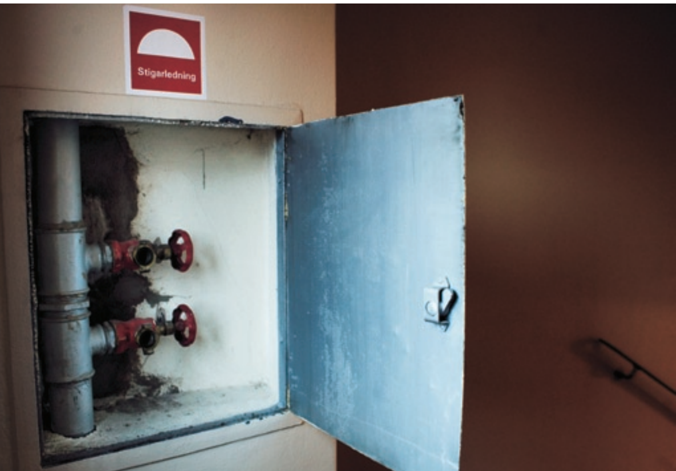
Via stigarledningen i trapphuset får räddningstjänsten vattenförsörjning utan att behöva dra slangar hela vägen från bottenvåningen.