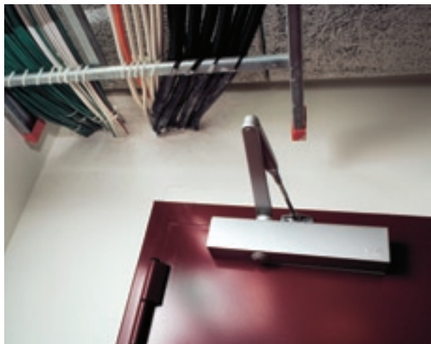
Hål som tas upp i brandcellsgräns, för till exempel dragning av ledningar, måste tätas ordentligt. Dörrstängare får inte hakas av.