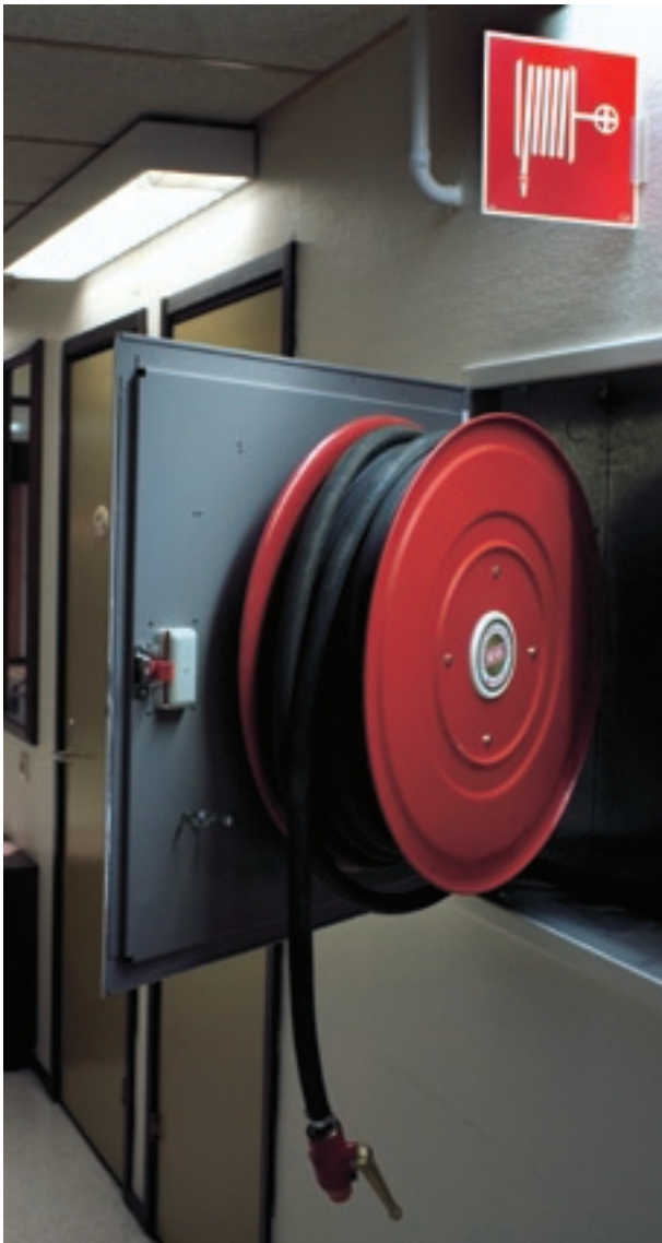
En vattenslang i styv plast är lätt att hantera och finns alltid på plats.