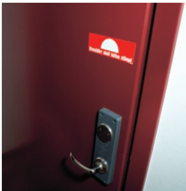
Det är mycket viktigt att branddörrar hålls stängda. De får inte ställas upp med kilar eller dylikt.