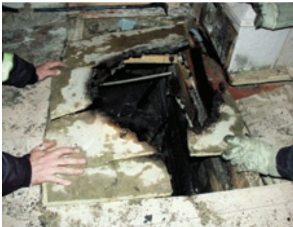
Felaktigt hanterad aska är en vanlig brandorsak. Här har golvet brunnit när aska från en kakelugn som det eldats i dagen före ställts i en plastpåse på golvet.

sotning och brandskyddskontroll ska ske för varje fastighet. Fastighetsägaren måste dock anmäla om det sker ny- eller ombyggnation av eldstäder och rökkanaler. Anmälan ska också ske om omfattningen av eldningen markant ökar eller om byte av bränsleslag sker.