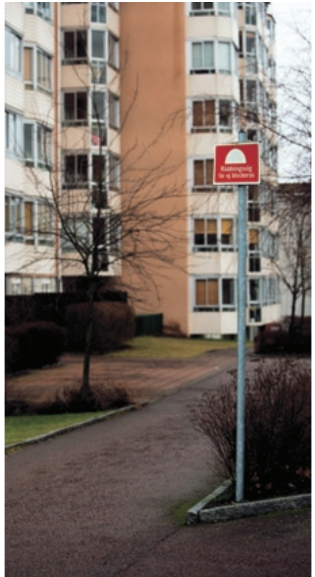
Räddningsvägar ska hållas snöröjda och fria från andra hinder.