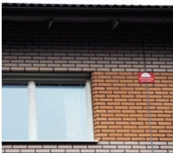
Tips: Om byggnaden har brandsektionerad vind är det en bra idé att ha skyltar med texten "Sektionering på vinden" uppsatta på fasaden där sektioneringarna finns. Då ser räddningstjänsten direkt var de är.

Observera att brandsäkerheten i äldre trähus vanligtvis är mycket sämre eftersom dörrar och väggar inte är utformade för att klara en brand på samma sätt som i nyare byggnader. Exempelvis kan en brand snabbt ta sig genom en tunn spegeldörr i trä. Har dörren dessutom glasrutor, kan branden sprida sig ännu fortare. I sådana hus är brandskyddet särskilt viktigt. Eventuellt bör förstärkningsåtgärder övervägas. En sådan kan vara att byta ut eller förstärka lägenhetsdörrarna.