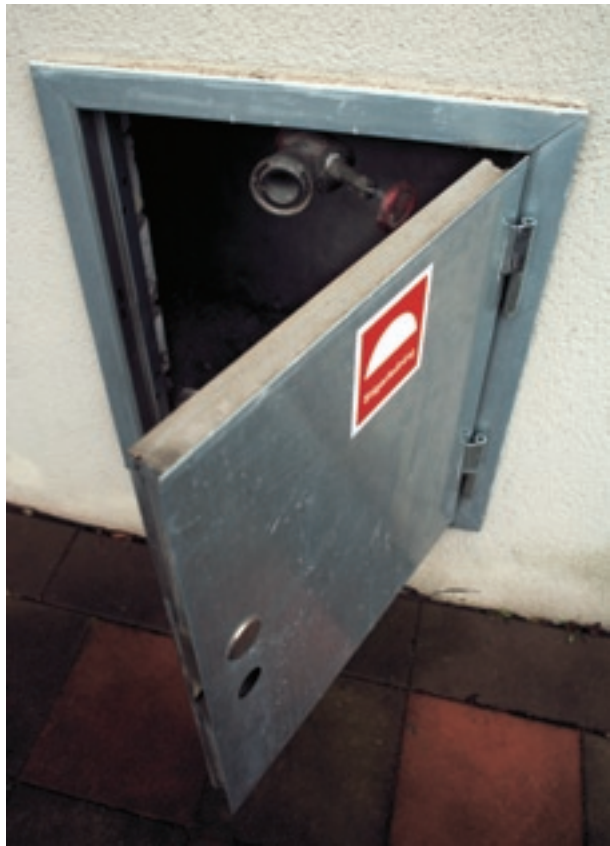
I stigarledningen i luckan på fasaden kan räddningstjänsten koppla in vatten. Inne i trapphuset finns sedan uttag där slangar kan anslutas.

I trapphus utgörs brandventilationen ibland av vanliga öppningsbara fönster. Det är viktigt att se till att lekande barn inte kan falla genom dessa. För att hindra olyckor kan exempelvis ett utvändigt galler användas.